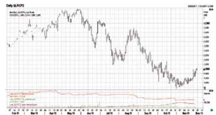
Динаміка цін на каву робуста в Лондоні (січень 2012 р.)