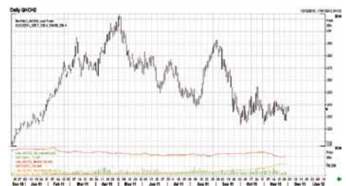
Динаміка цін на каву арабіка в Нью-Йорку (березень 2012 р.)